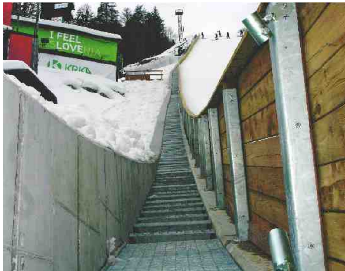
ČRNA GRADNJA – Ministrstvo za šolstvo in šport je vlogo za dovoljenje za gradnjo opornega zidu na levi strani doskočišča vložila šele 22. februarja, čeprav je bil takrat že sezidan. Gradbeno dovoljenje pričakujejo do konca tega meseca, do takrat pa bo zid črna gradnja.

LJUBLJANA – Poklicno maturo iz vseh štirih predmetov je v zimskem roku uspešno opravilo 425 od 587 kandidatov oziroma 72,4 odstotka vseh udeležencev (lani 77 odstotkov). Preizkus je na 150 srednjih solah in ustanovah za izobraževanje odraslih opravljalo 1741 kandidatov (lani 1747), od tega 187 dijakov in 1554 odraslih. Nekateri so maturo opravljali delno, drugi pa iz vseh štirih predmetov: dva obvezna – materni jezik in strokovni-teoretični predmet, in dva izbirna – tuji jezik ali matematika ter praktični izdelek. Zimski izpitni rok poklicne mature je potekal med 9. in 26. februarjem. Tisti, ki niso bili uspešni, bodo lahko znanje znova preverili v spomladanskem roku med 26. majem in 24. junijem. N. D.