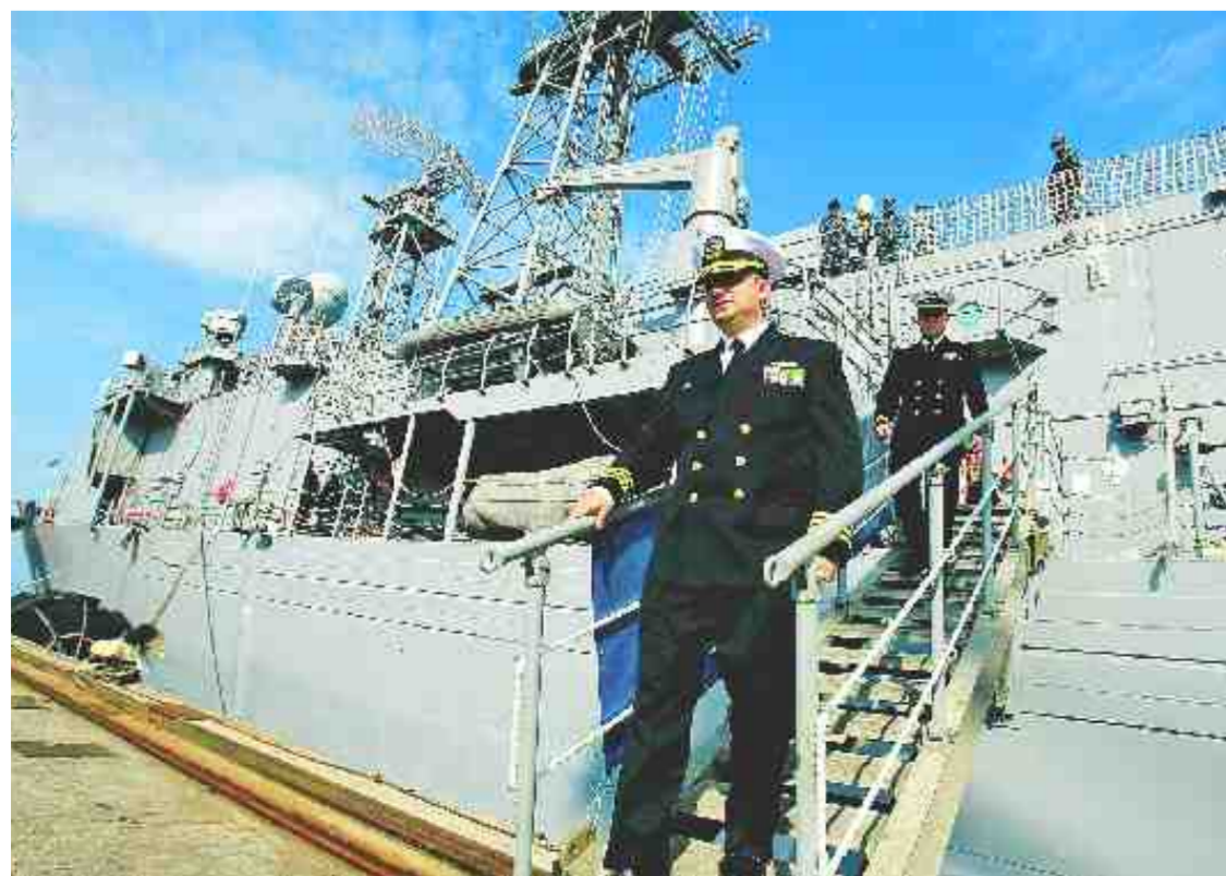
PRVIČ V JADRANSKEM MORJU – Ameriška fregata je pred slovenskim pristaniščem že obiskala Romunijo, Turčijo, Grčijo in Italijo.