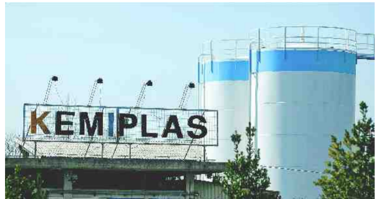
VODSTVO TOVARNE ZANIKA IZREDNI DOGODEK